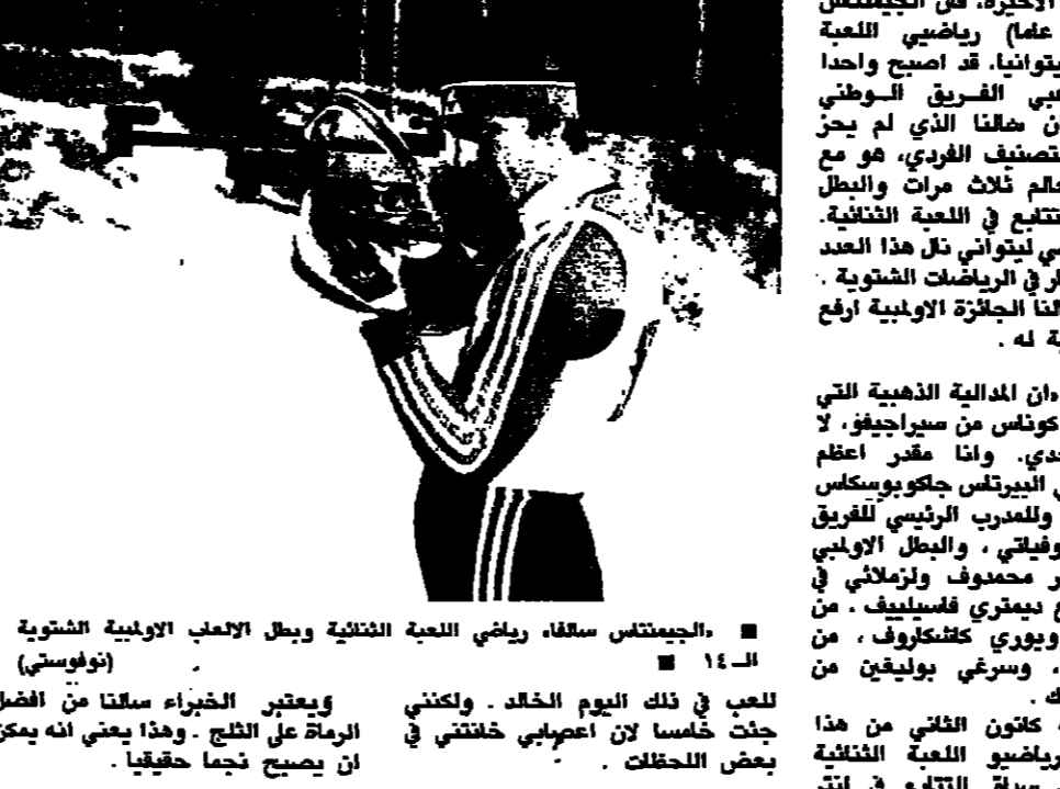
«الجمبناست سالنا، رياضي اللعبة الثلجية وبطل الالعاب الاولمبية الشتوية»